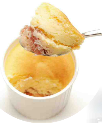
Miyajima An to Cheese Cheese Cake with shiranu 和洋アントチーズ