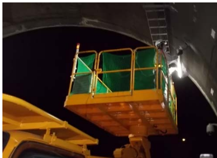
【トンネル照明交換】