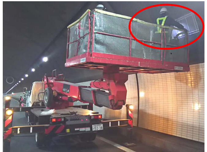
部分的に劣化したトンネル覆工のはく落対策を実施。