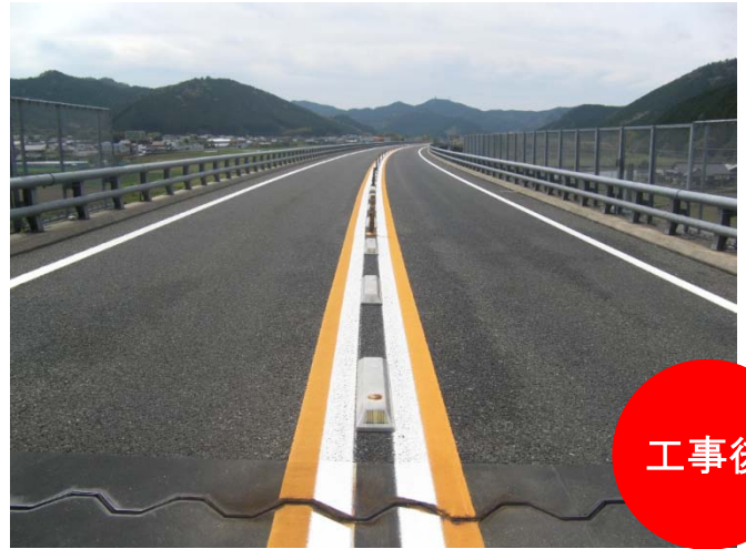
路面標示の引直しを実施。