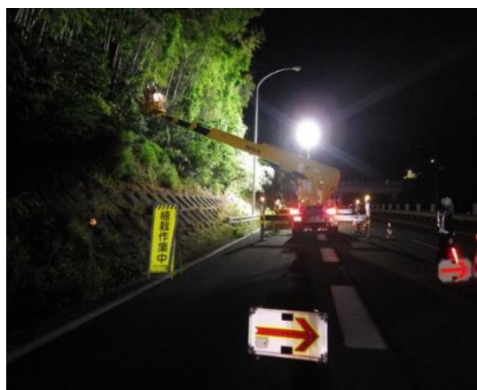
《樹木伐採(作業イメージ)》

のり面、道路施設等を常時良好な状態に保つため樹木伐採・補修・点検・清掃等を行います。