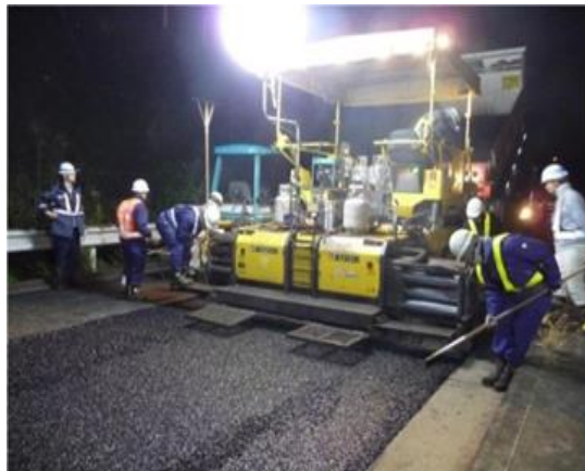
《舗装補修工事(施工イメージ)》

走行安全性・快適性の確保のため、舗装面のひび割れや段差などが顕著に発生している箇所を修復する舗装補修工事を行います。