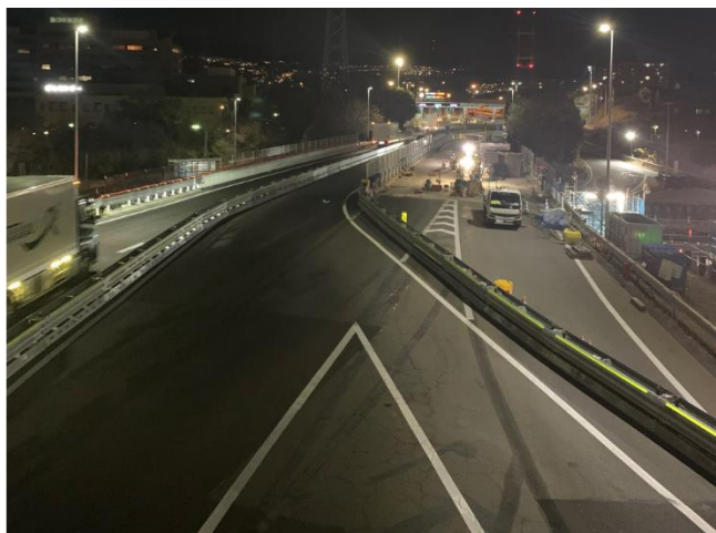
対面通行規制状況