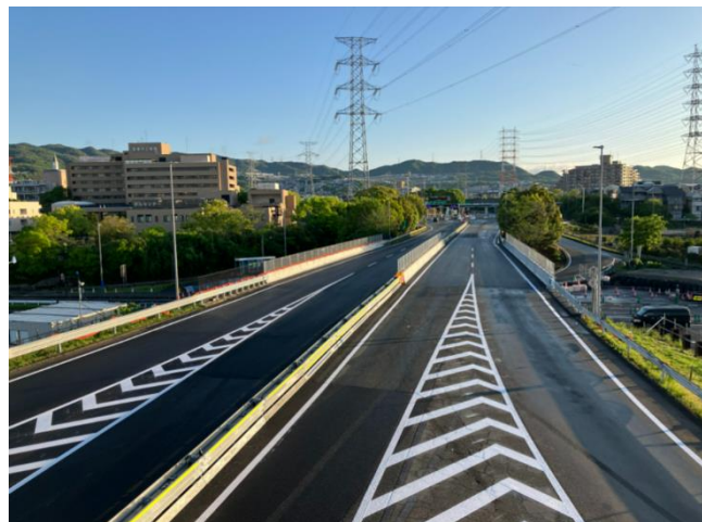
対面通行規制解除状況