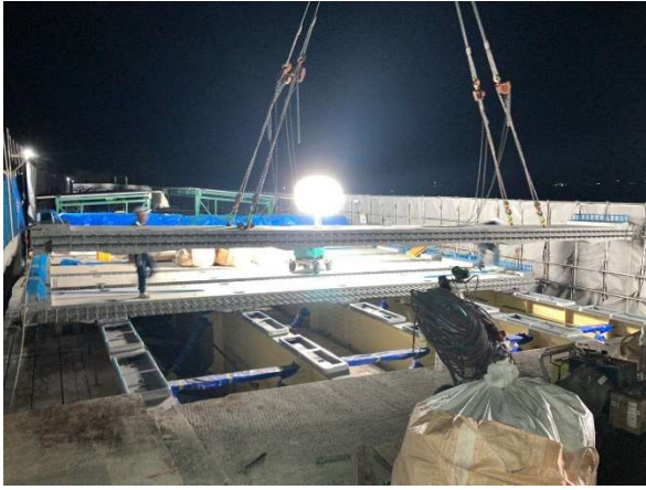
新設床版の設置作業状況