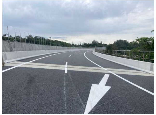
床版取替 施工後(床版防水工施工前)