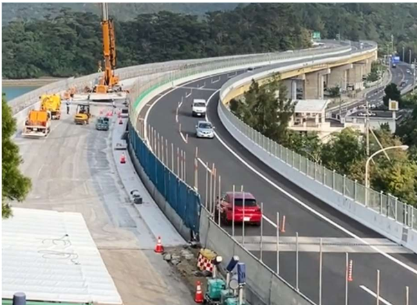
対面通行規制状況