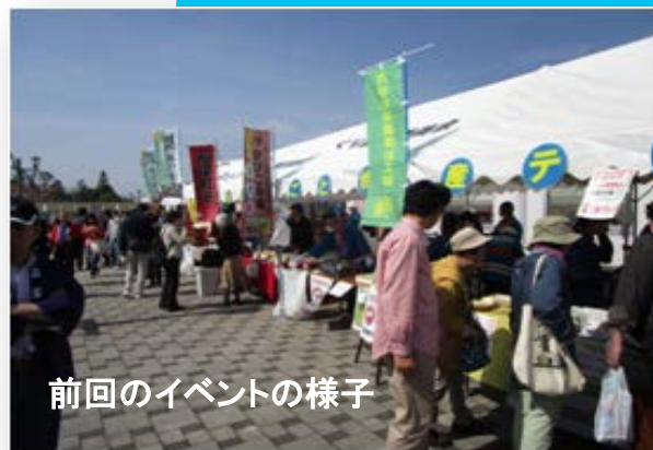
前回のイベントの様子