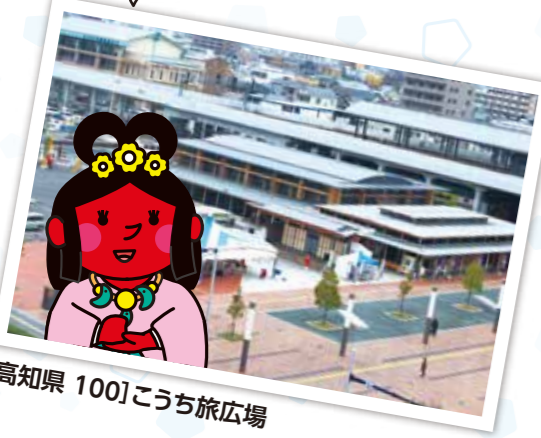
[高知県 100] こうち旅広場

高知県観光のスタートに 行ってみましょ! ステージイベントが開催 されることもあるわよ!