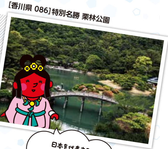
[香川県 086] 特別名勝 栗林公園