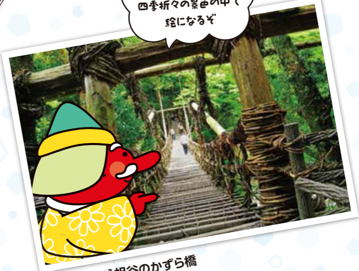
[徳島県 081] 祖谷のかずら橋